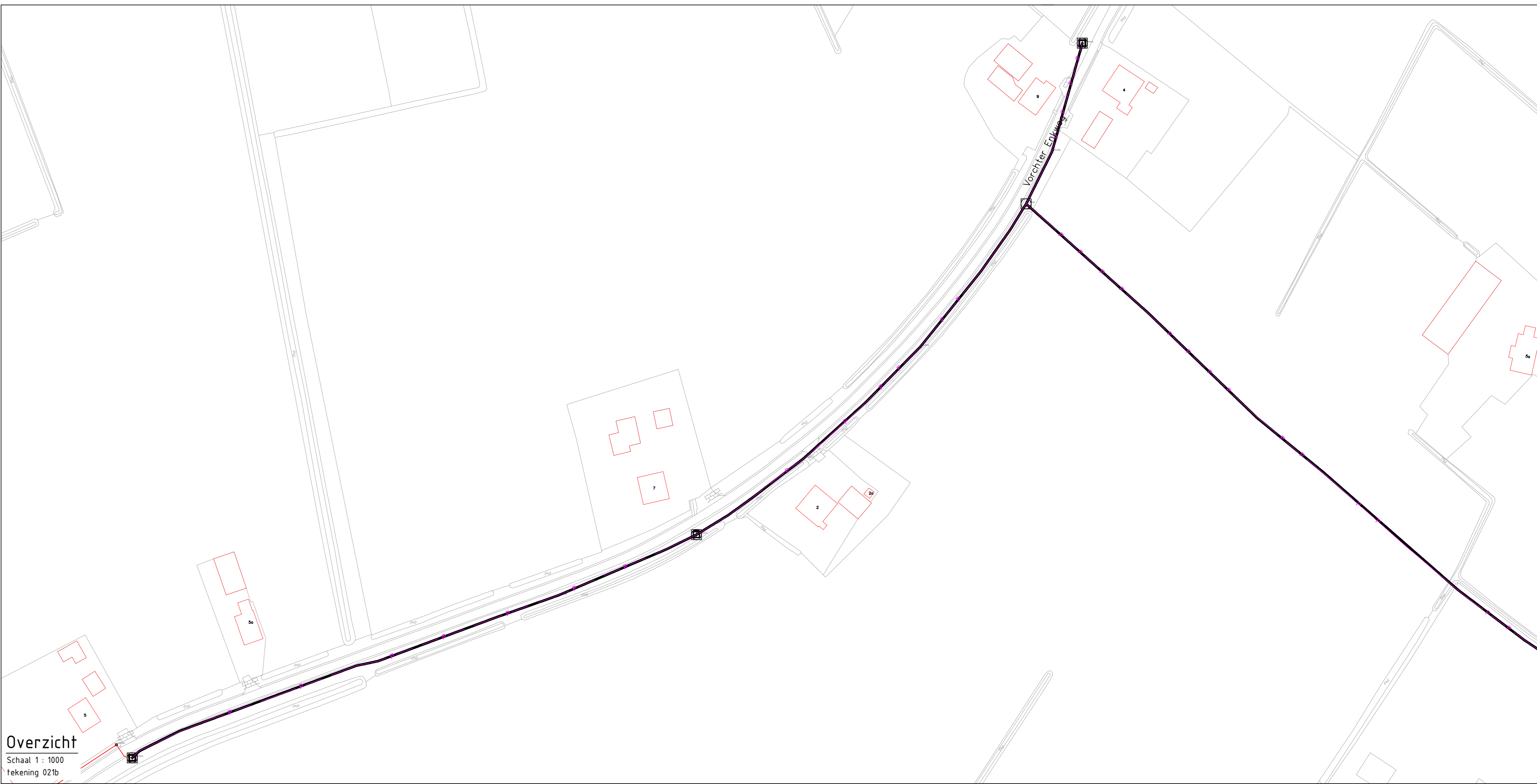
Overzicht Schaal 1 : 1000 Tekening 021b