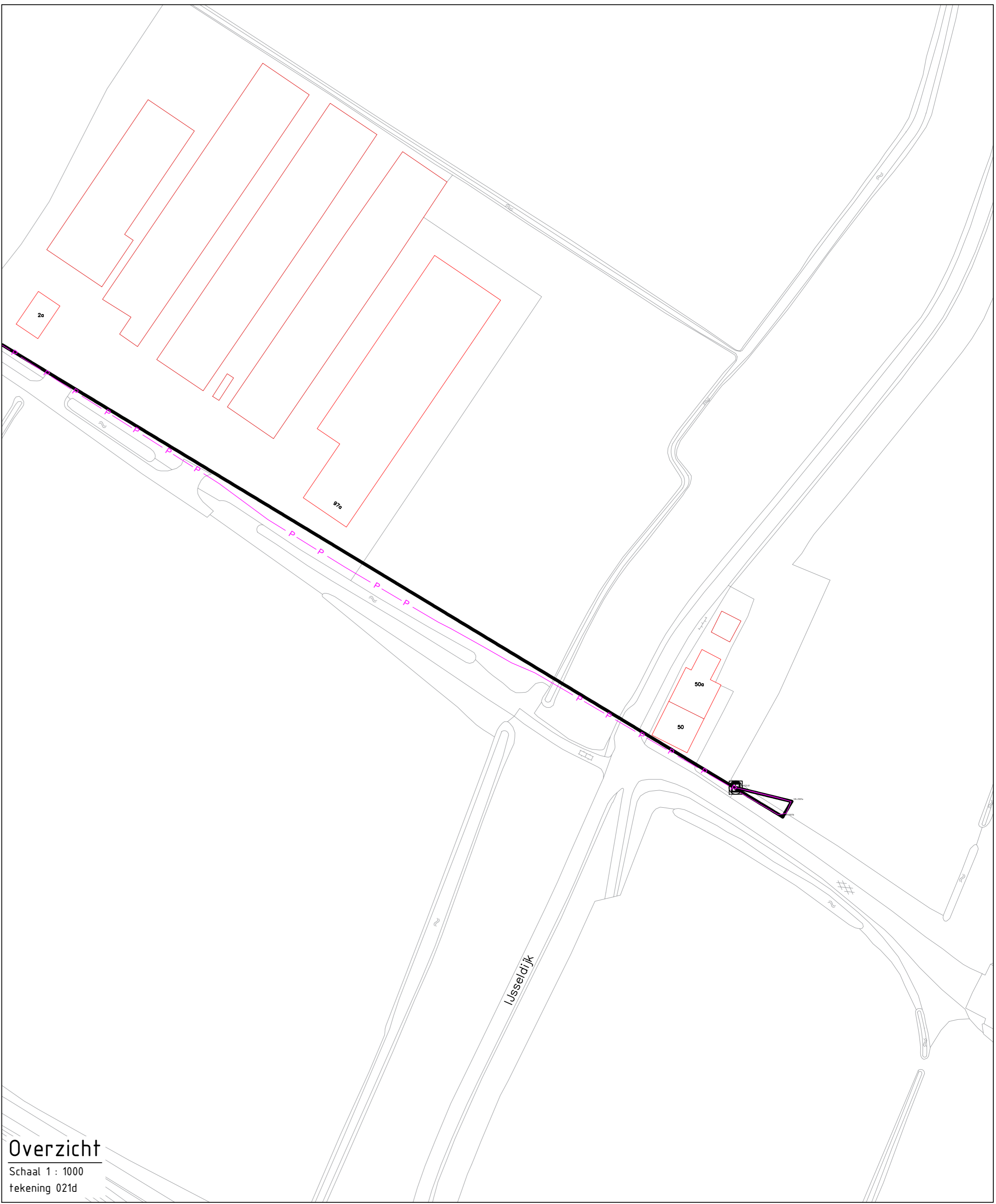
Overzicht Schaal 1 : 1000 Tekening 021d